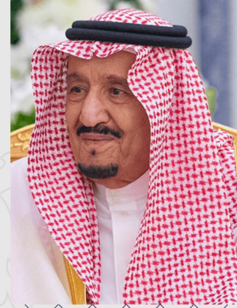
خادم الحرمين الشريفين

الأمير محمد بن سلمان بن عبدالعزيز آل سعود