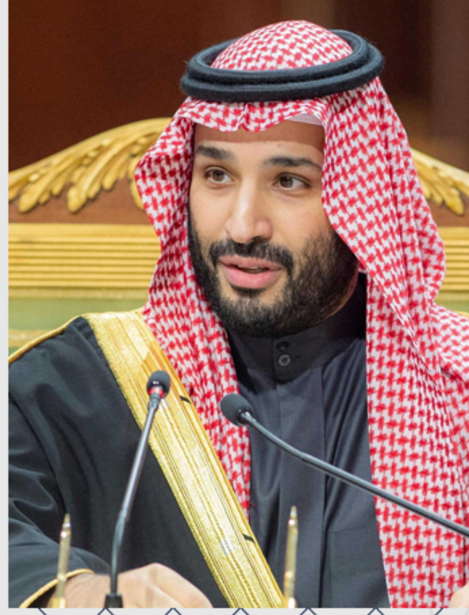
صاحب السمو الملكي

الأمير محمد بن سلمان بن عبدالعزيز آل سعود